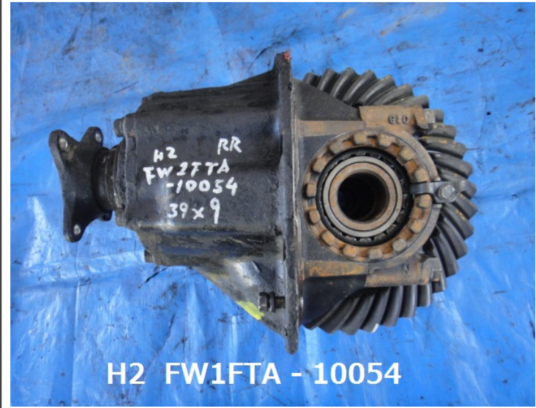
H2 FW1FTA - 10054