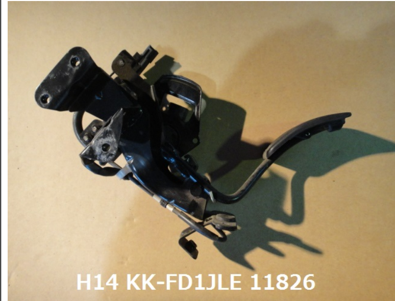
H14 KK-FD1JLE 11826