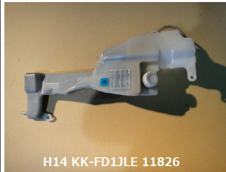
H14 KK-FD1JLE 11826