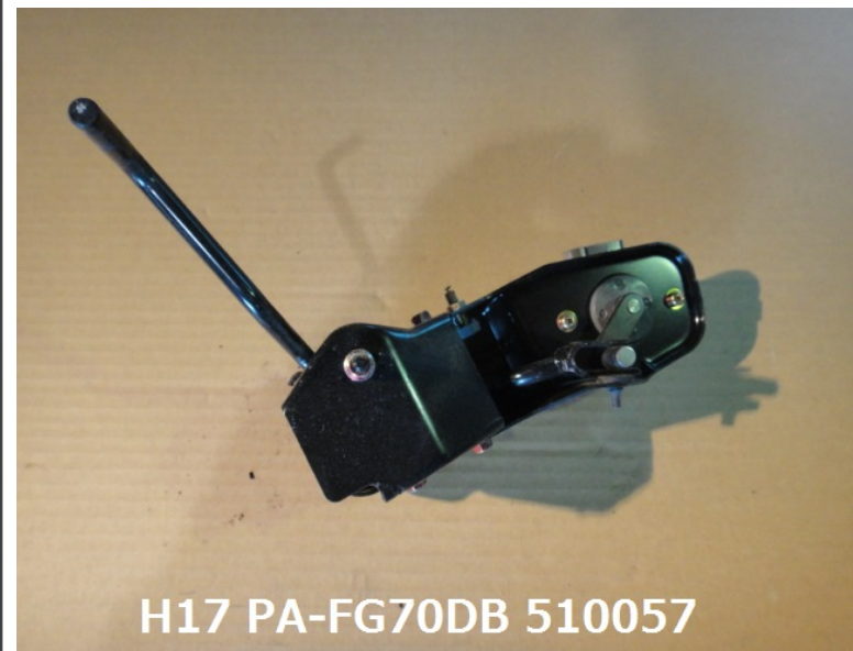
H17 PA-FG70DB 510057