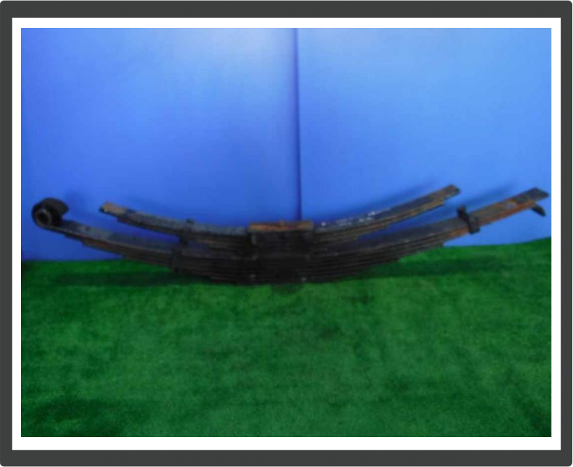
コメント メイン7枚/サブ5枚