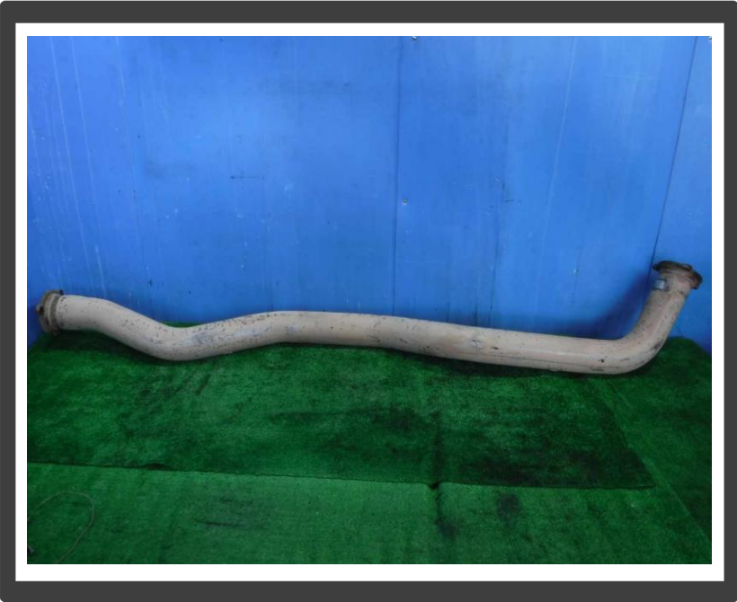
コメント 中間パイプ