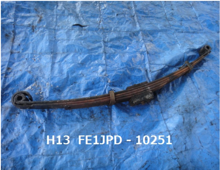
H13 FE1JPD - 10251