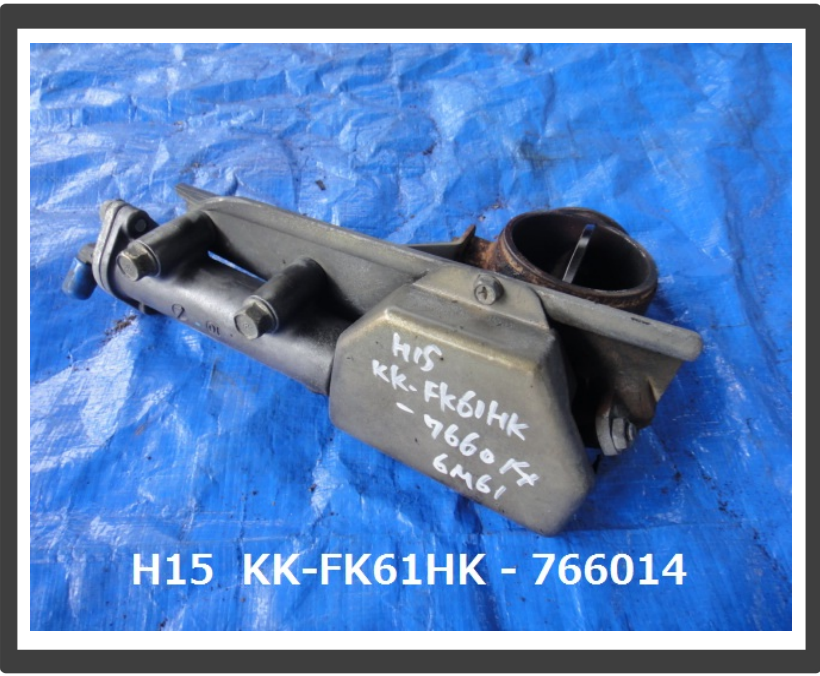
H15 KK-FK61HK - 766014