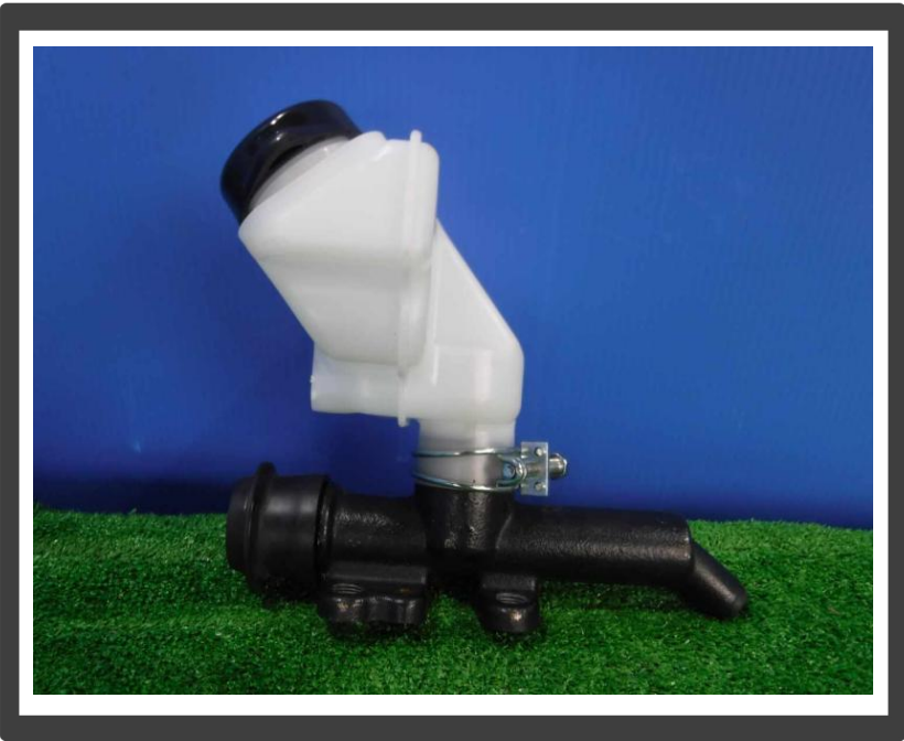
コメント クラッチマスターシリンダー