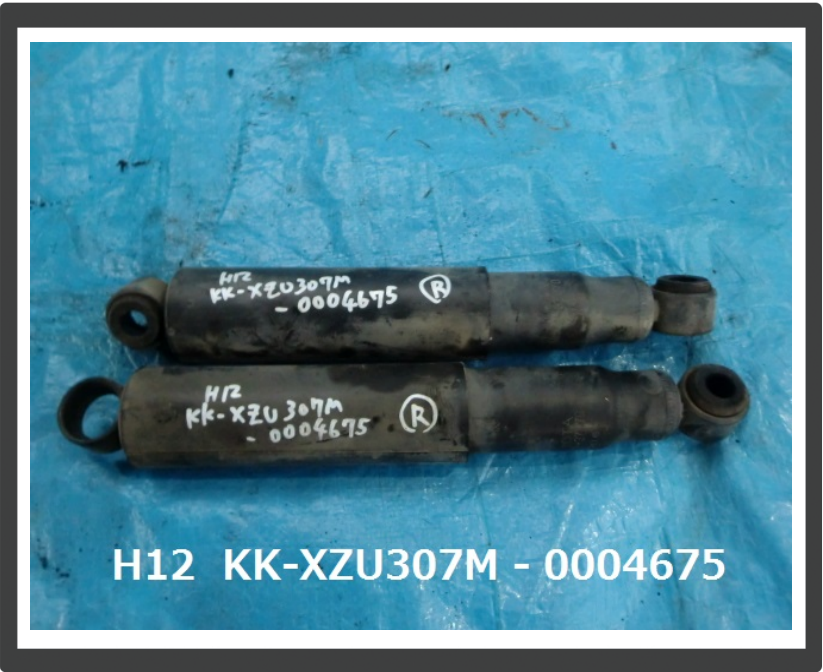
H12 KK-XZU307M - 0004675