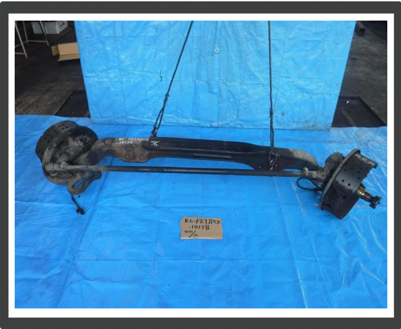
コメント 左右ナックル付