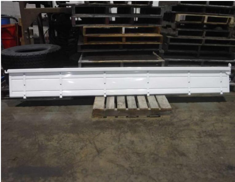
写真1: 白/スチール(裏側プラ)/L:3540、W:50、H:420