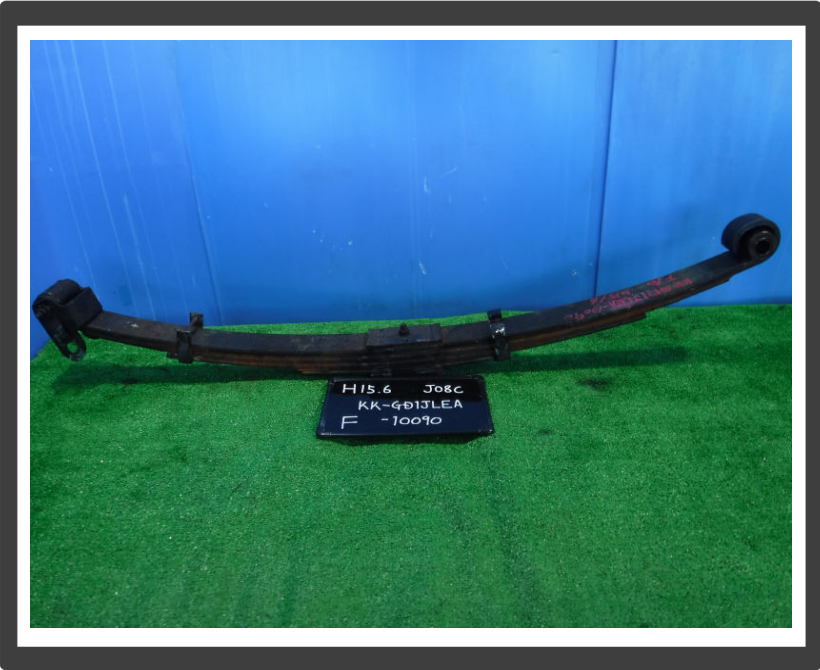
コメント フロントリーフスプリング/4枚