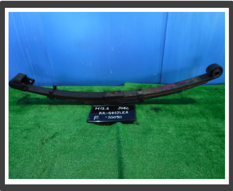
コメント フロントリーフスプリング/4枚